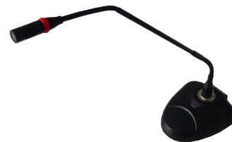
Microphone de table