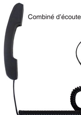
Cordon spiralé RJ/jack 3,5 mm