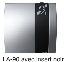
LA-90 avec insert noir

Remarque : Lorsque le système est actif, le voyant marche/arrêt à l'arrière du LA-90 est vert et le voyant de contrôle à l'avant bleu. Le microphone de table et le combiné d'écoute sont opérationnels.