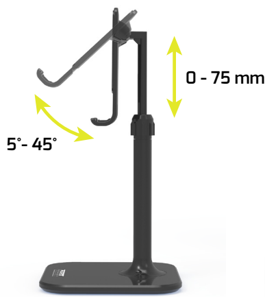
Height & angle adjustable Hauteur & angle ajustables