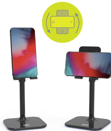
Hands free solution with dual orientation in portrait & video Solution mains libres avec double orientation en portrait et en vidéo