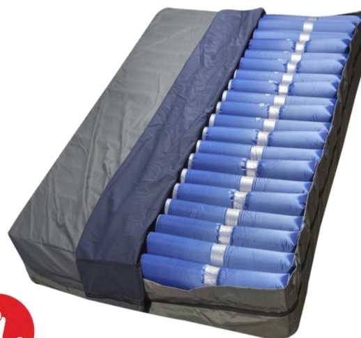
NAUSIFLOW 100 834 120