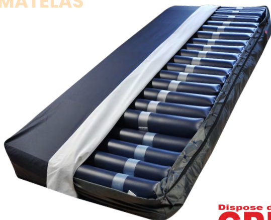
NAUSIFLOW 100 834 ERGO (85 cm)