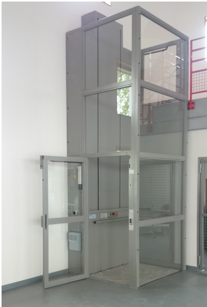
Gaine vitrée avec encadrement en acier ou en aluminium