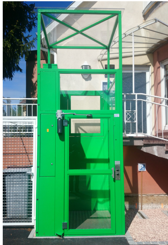
Gaine vitrée avec toiture et couleur spéciale

Conçu pour une installation extérieure, le mécanisme à chaîne double et un équipement électrique robuste garantissent un fonctionnement fiable.