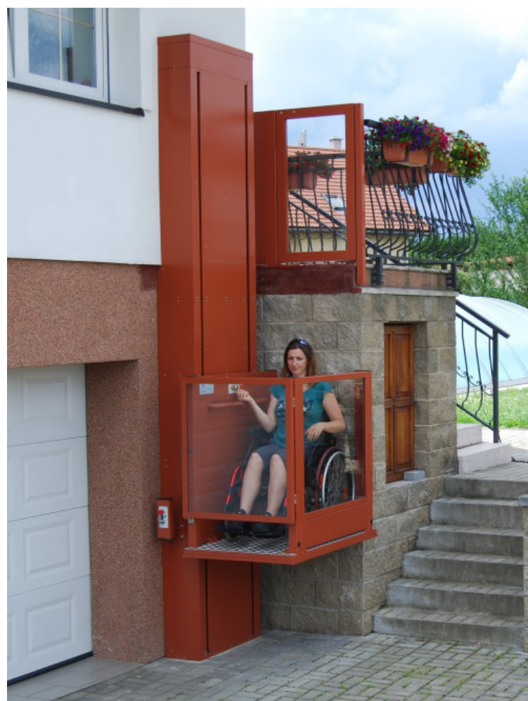
Fixation au mur de la tour d'élévation