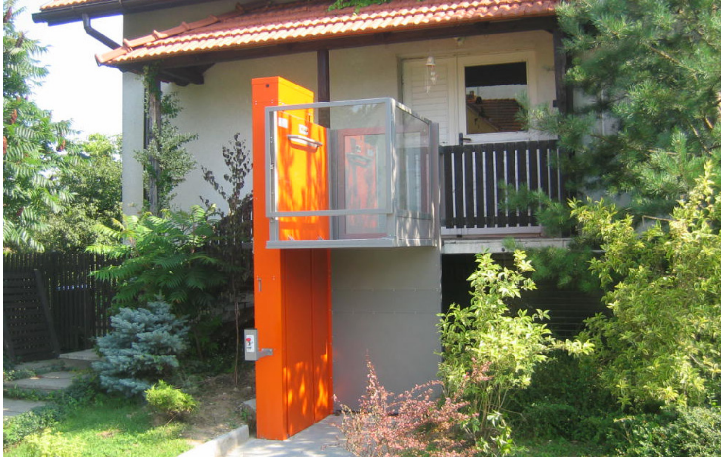
Tour d'élévation en couleurs spéciales